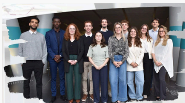
Les Membres de GCCA

Le CAFE COACHING , événement incontournable de la filière, célébrant sa onzième édition, s'est déroulé dans le forum du campus Pasteur de l'Université de Rouen Normandie.